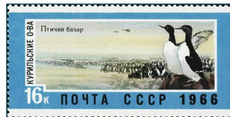
Почтовая марка СССР 1966 г. «Курильские острова. Птичий базар»

СССР и Япония вместо него подписали 19 октября 1956 г. Московскую декларацию, предусматривавшую прекращение состояния войны и восстановление дипотношений. СССР отказался от всех репараций и претензий к Японии, обязался освободить всех её граждан. Подписание декларации открыло для Японии дорогу в ООН. Документ гласил, что после установления дипотношений стороны продолжат переговоры о заключении мирного договора, а СССР (в качестве жеста доброй воли) соглашается на передачу, после заключения мирного договора, гряды Хабомаи и острова Шикотан [1, с. 665]. Декларация давала Японии значительно больше, чем СССР.