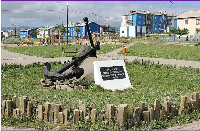
г. Южно-Курильск. На памятнике надпись «Русским первооткрывателям курильских островов. 1739 – 1989»

1991 г. М. С. Горбачёв подписал «Совместное советско-японское заявление», предполагавшее осуществление разработки и заключения договора между Японией и СССР, «включая проблему территориального размежевания с учётом позиций сторон о принадлежности островов Хабомаи, острова Шикотан, острова Кунашир и острова Итуруп». Впервые в официальном документе